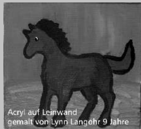
Acryl auf Leinwand gemalt von Lynn Langohr 9 Jahre

Anmeldungen bitte an das Pfarrbüro oder bei Sabine Stübner: 02407/3681